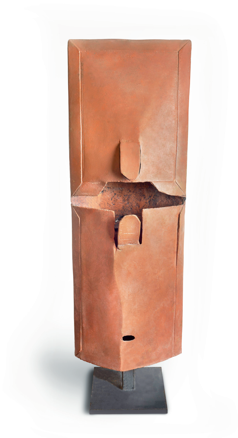
Tu forma me rodea, 1976 Resina 161 x 59 x 26 cm