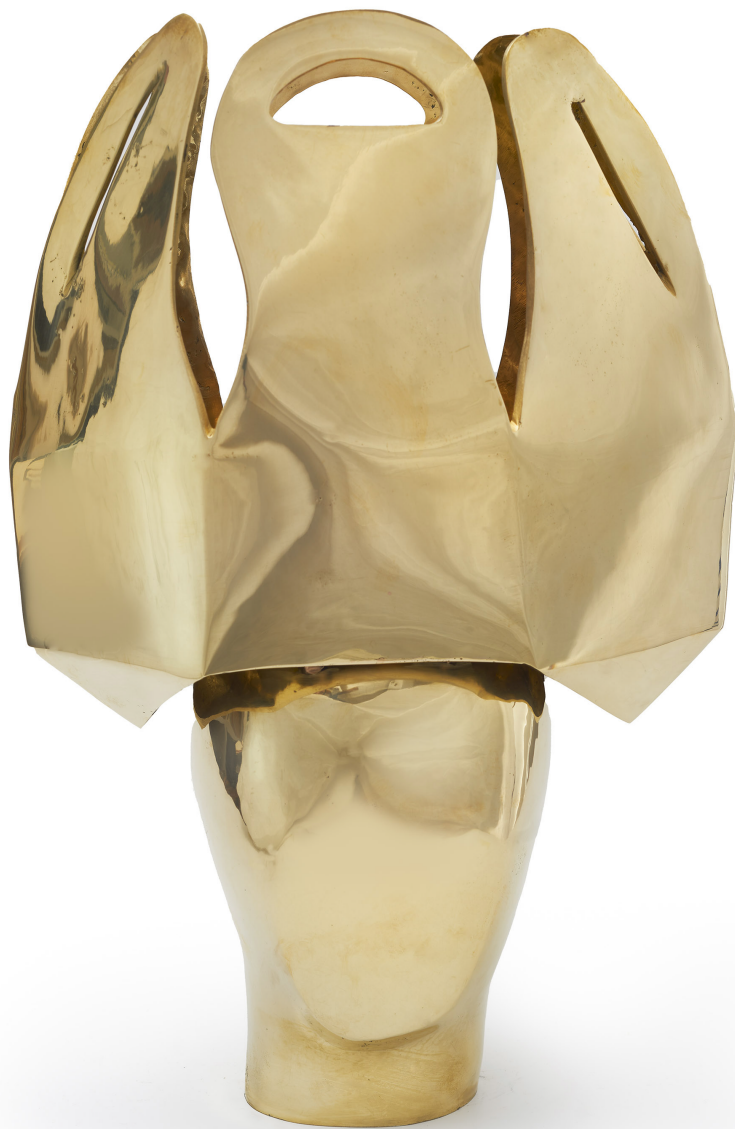
Corona E, 1978 Bronce 45 x 32 x 16.5 cm Edición 4/6