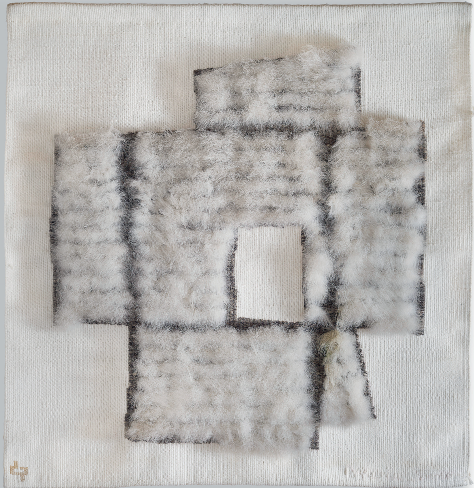
Caja nº I, 1975 Tapiz de lana y pluma 124.5 x 119 cm