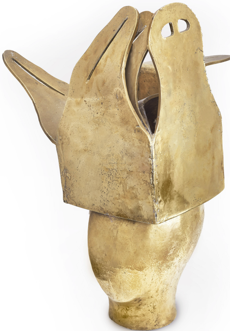
Corona L, 1978 Bronze 49 x 35 x 28 cm Edición 3/6