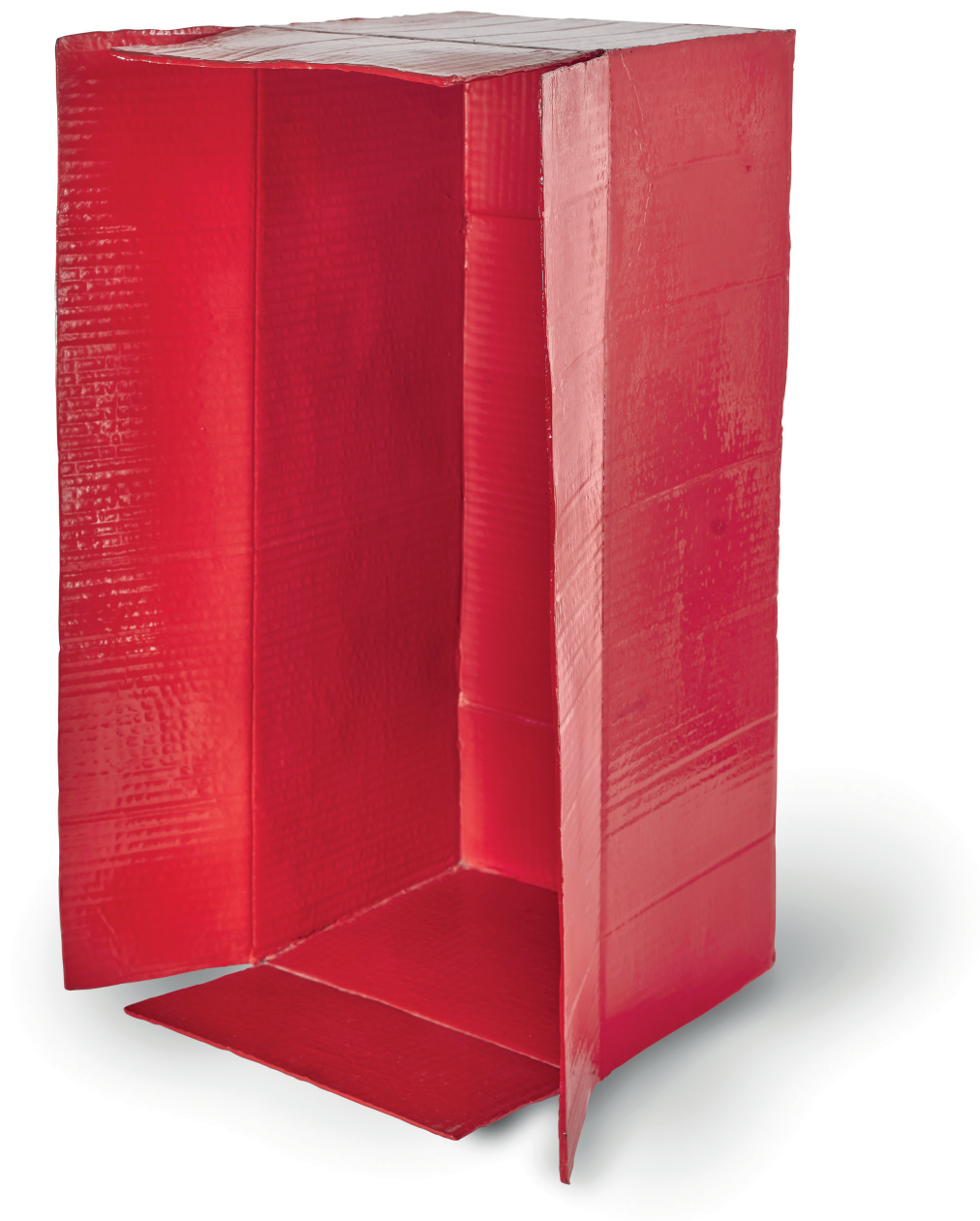
Sin título, 2008 Técnica mixta 58.5 x 36.5 x 32 cm